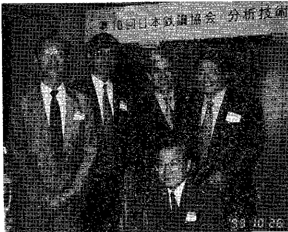
写真1 懇親会場にて

最後に、本部会開催にあたってご協力いただいた関係各位にこの場を借りて御礼申し上げる。