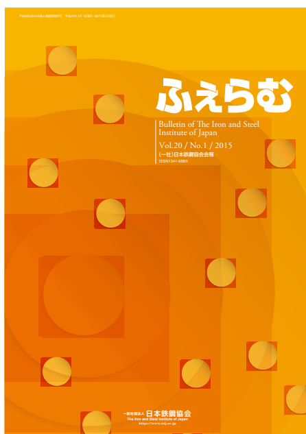
ふえらむ2015年1号 表紙

また、2015年中は従来通り「ふえらむ」の冊子版も全会員に配布されますが、2016年から冊子体の配布を停止し、冊子体希望者に有料で提供することになります。これを機会に「ふえらむ」の表紙を、鉄原子の原子核をモチーフとし、原子核のように作り上げていくとのコンセプトで一新しました。今後ともリニューアル版「ふえらむ」もよろしくお願いたします。